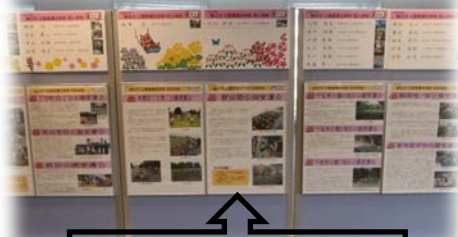
西区の紹介はコチラ

受賞したふたつの愛護会では、毎年春と秋の2回、土木事務所から花苗を提供し、愛護会メンバーだけで植え付けを行っています。