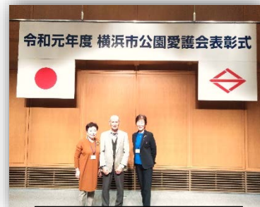
3人並んで記念撮影